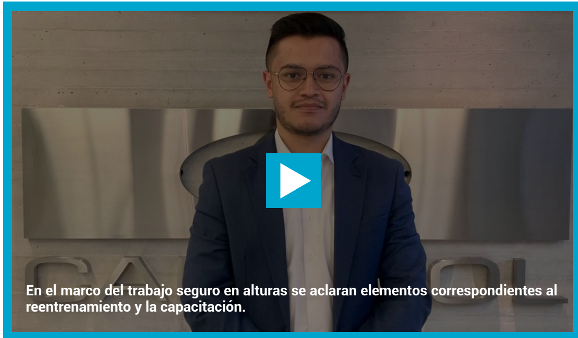
Circular 0036 de 2022. Ministerio del Trabajo.